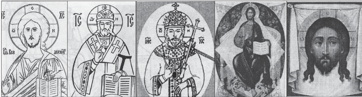
Господь Пантократор, Спас Великий Архиерей, Спас Царь Царей, Спас в силах, Спас Нерукотворный

Иконографический тип «Спас в силах» изображает благославляющего Христа, восседающего торжественно на престоле с раскрытым Евангелием. Основой такой иконографии служат ветхозаветное «Видение пророка Иезекииля» и «Откровение» Иоанна Богослова. в согла-