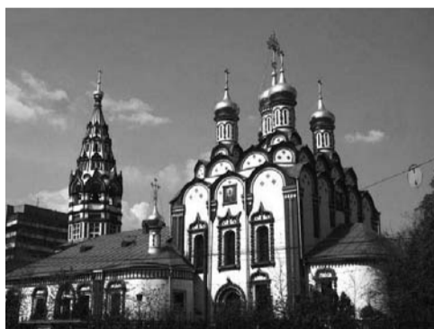
▲ Храм Святого Николая в Хамовниках

Название иконы «Споручница грешных» говорит само за себя: Пресвятая Богородица – Первая и Вернейшая Ходатаица и Поручительница пред Сыном Своим и Богом за всех грешников, при-