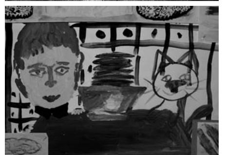
Лучшие работы учащихся нашей воскресной школы, отправленные на конкурс Красота Божьего Мира