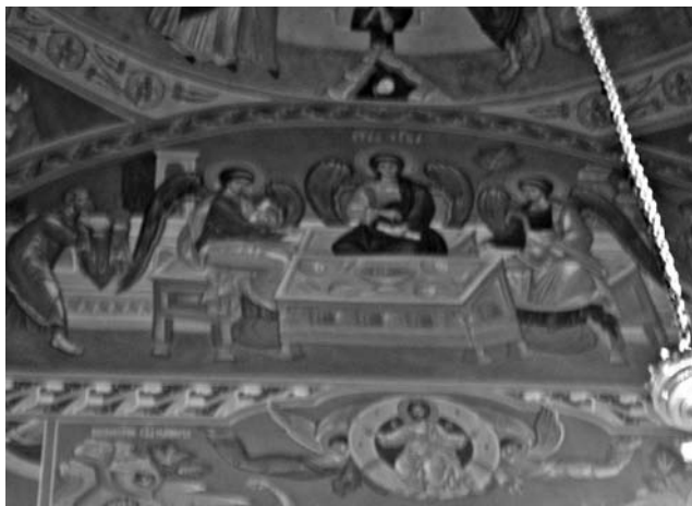
▲ Историческая Троица (надальтарное пространство нашего храма).

Купол любого православного храма держится на «парусах» – изгибающихся конструкциях, скрепляющих купол с основной частью храма. По традиции на них всегда изображаются 4 евангелиста, ибо и парусов всегда – 4. Наш храм – не исключение. Этим Церковь подчеркивает, что здание Церкви строится на 4 Евангелиях, распространяющих Благою весть на все 4 стороны света, по слову Спасителя: «идите по всему миру и проповедуйте Евангелие всей твари» (Марк 16:15). Кроме того, изображения Евангелистов предшествуют Его изображению в царской славе (Пантократор) и в Страстях, может быть потому, что только Евангелие открывает путь к Царствию Небесному и только вкусив от красоты Евангельского учения, можно решиться пойти «тесным» путем скорбей, а не пространством путем погребения, по которому идут многие. Ярусом ниже, на восточной (т.е. на той стороне, где расположен алтарь) стене, прямо под изображением Распятия, изображена Пресвятая Троица, в том виде, в каком Она явилась праведному Аврааму. Этот тип изображения называется «исторической Троицей», потому что рядом с тремя Ангелами нарисованы Авраам и Сарра, с разных сторон несущих ко столу еду, т.е. это изображение просто «исторически» воспроизводит повествование книги Бытия (глава 18). Но мы знаем и другой тип изображения Троицы – как