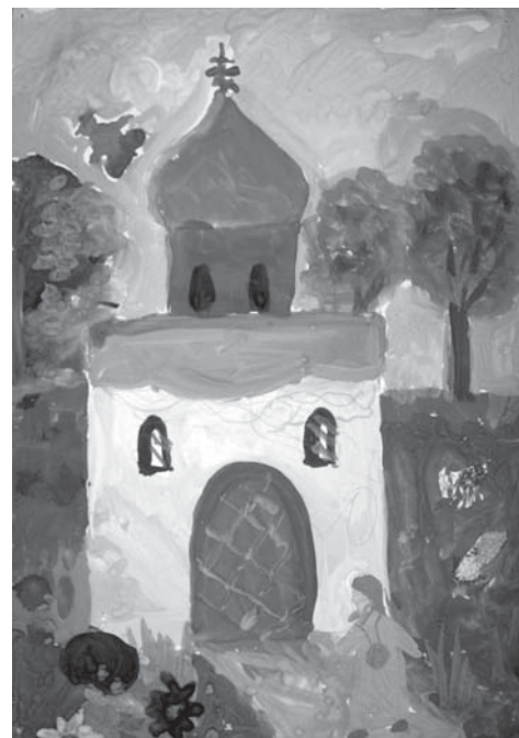
Настя Дриевская (6 лет), «Храм»