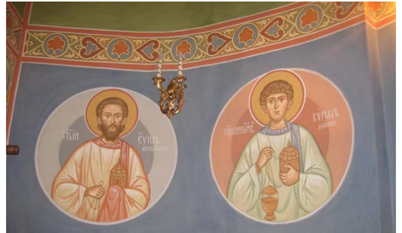
▲ Св. архидиакон Евл и свщмч. Кирилл. Алтарь придела свщмч. Владимира, митрополита Киевского и Галицкого

«Бог дивный во святых, Хранит вся кости их, И ни единая от них не сокрушится, Да имя Божие святится. Зреть тленное нетленным существо Неверю — соблазн, а вере торжество» (неизвестный автор)