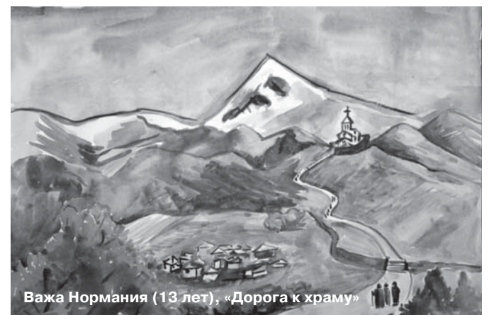
Важа Нормания (13 лет), «Дорога к храму»

УЧРЕДИТЕЛЬ: Православный приход храма Живоначальной Троицы в Старых Черемушках