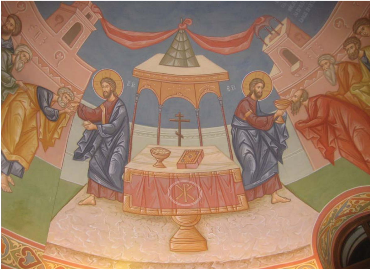
▲ Причастие Св. Апостолов. Алтарь придела свщмч. Владимира, митрополита Киевского и Галицкого