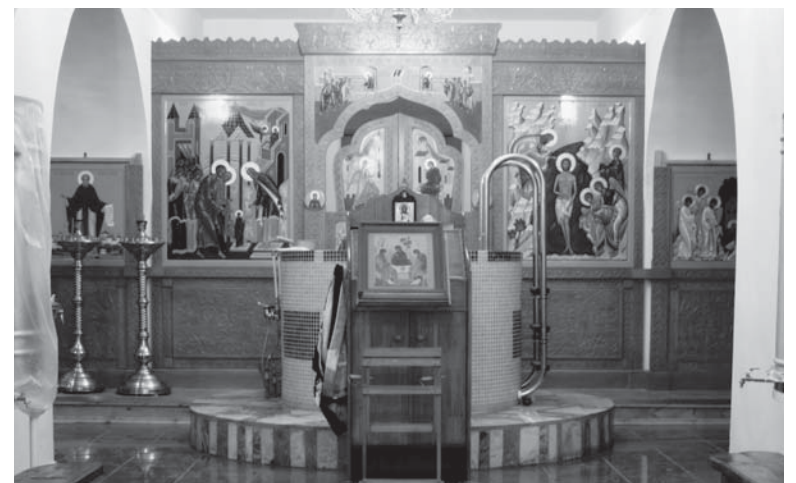
▲ Крестильный храм преп. Александра Свирского