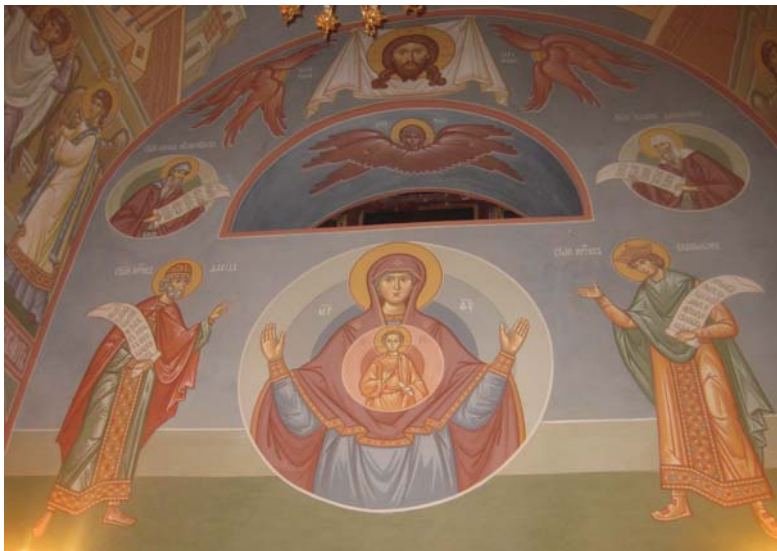
▲ Богоматерь «Знамение». Алтарь придела свщмч. Владимира, митрополита Киевского и Галицкого